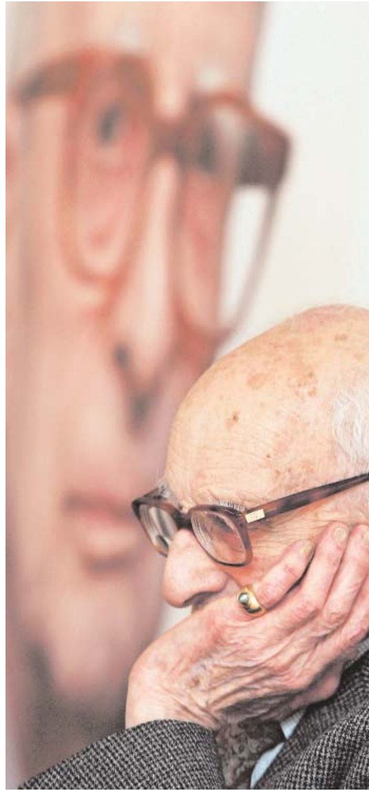
Nachdenken über sich selbst: Claude Lévi-Strauss (1908-2009)