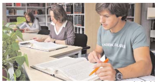
Konzentration: Wenn der Kopf frei von Geldsorgen ist, lernt es sich besser.